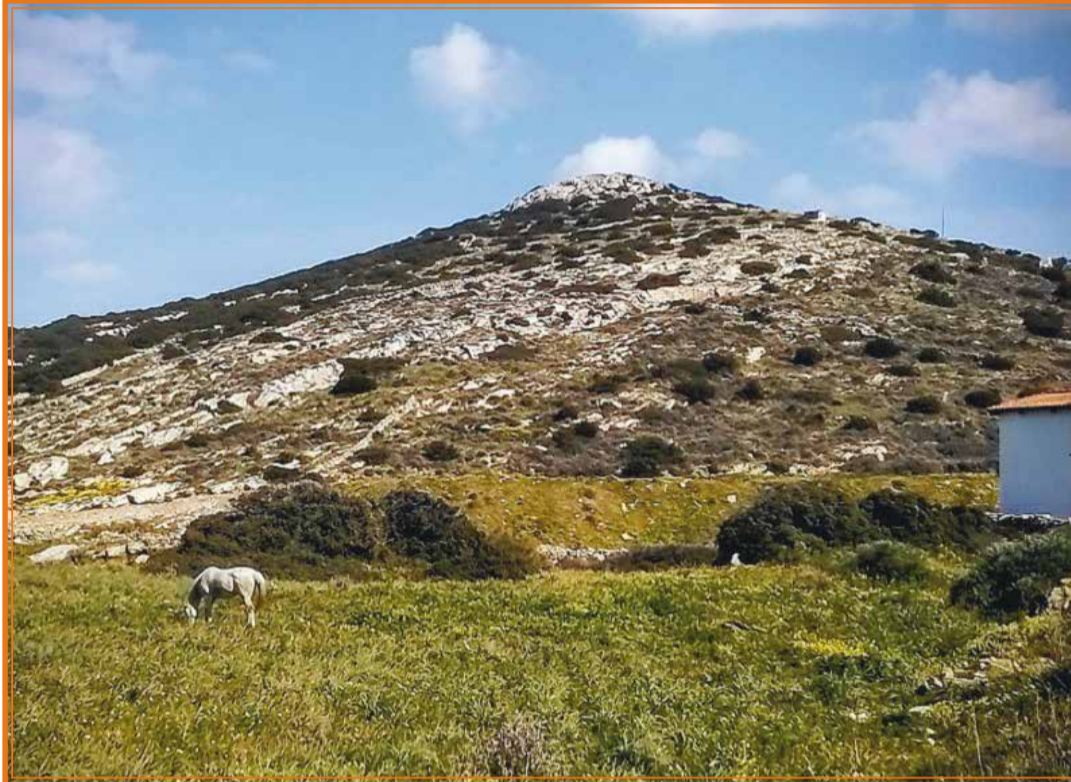
Η φωτογραφία της ημέρας: Υπαιθρος Σύρου. Στείλτε μας δικές σας φωτογραφίες στο e-mail: info@koinignomi.gr

Ανατολή ηλίου: 06:29 Δύση ηλίου: 18:35 Ανατολικό: Χρυσάνθου και Δαρείας, μαρτύρων. Δυτικό: Ιωσήφ μνήστορος της Θεοτόκου (πανήγυρη).