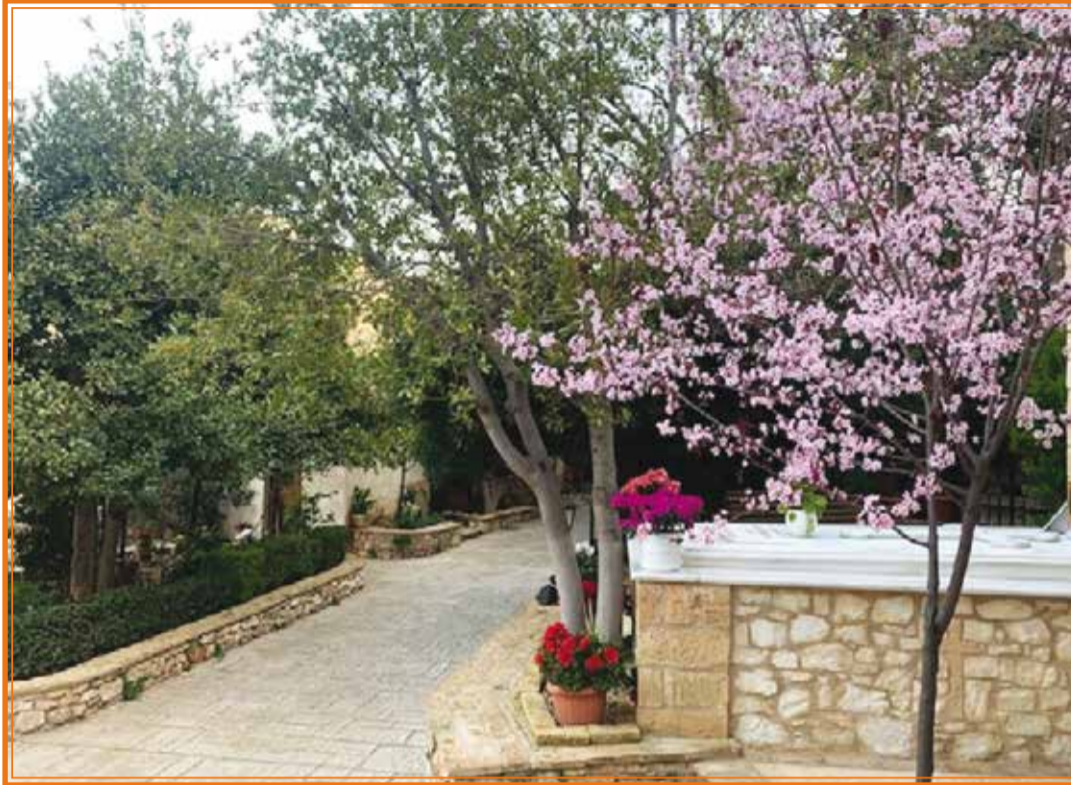
Η φωτογραφία της ημέρας: Άνοιξη. Στείλτε μας δικές σας φωτογραφίες στο e-mail: info@koinignomi.gr

Ανατολή ηλίου: 06:34 Δύση ηλίου: 18:32 Ανατολικό: Χριστοδούλου εν Πάτω. Δυτικό: Ευσεβείας, μοναχός.