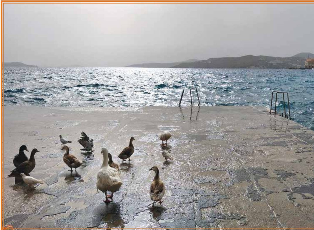
Η φωτογραφία της ημέρας: Πρωινόι επισκέπτες. Στείλτε μας δικές σας φωτογραφίες στο e-mail: info@koinignomi.gr