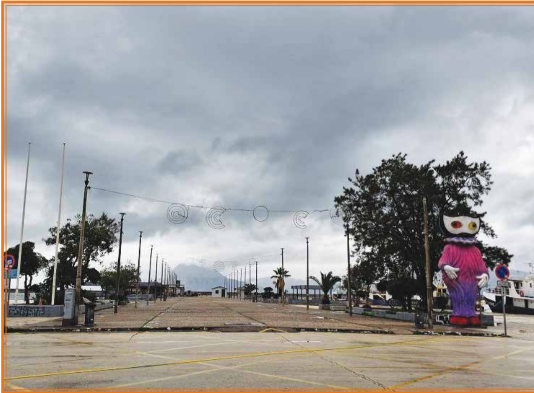
Η φωτογραφία της ημέρας: Αποκριάτικη βροχερή μέρα. Στείλτε μας δικές σας φωτογραφίες στο e-mail: info@koinignomi.gr