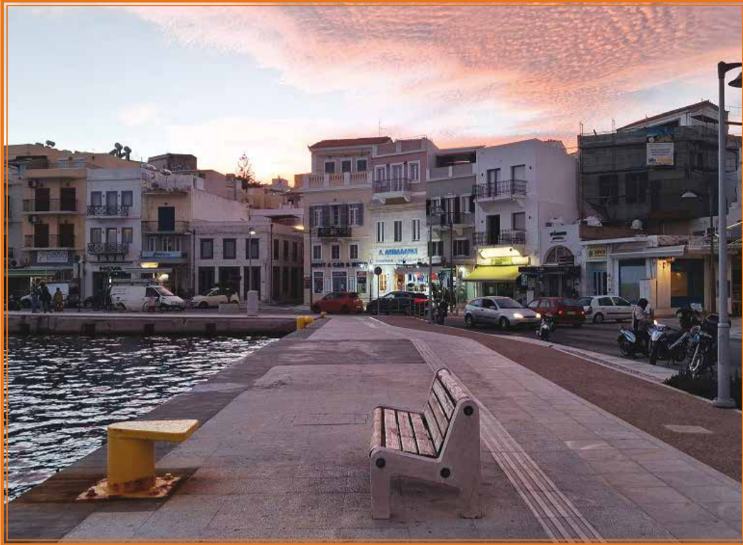
Η φωτογραφία της ημέρας: Μια εικόνα χίλια χρώματα! Στείλτε μας δικές σας φωτογραφίες στο e-mail: info@koinignomi.gr

Δυτικό: Εμφάνισως της Αειπάρθενου Μαρίας στη Λούρδη