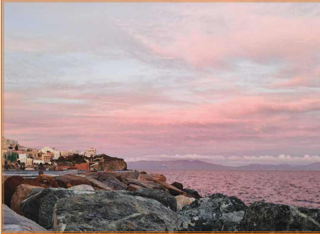
Η φωτογραφία της ημέρας: Με τη δύση του ήλιου. Στείλτε μας δικές σας φωτογραφίες στο e-mail: info@koinignomi.gr

Ανατολή ηλίου: 07:33 Δύση ηλίου: 17:42 Ανατολικό: Ιωάννου Χρυσοστόμου ανακομιδή λειψάνων. Δυτικό: Άγγελος Μερτίσι, παρθένου.