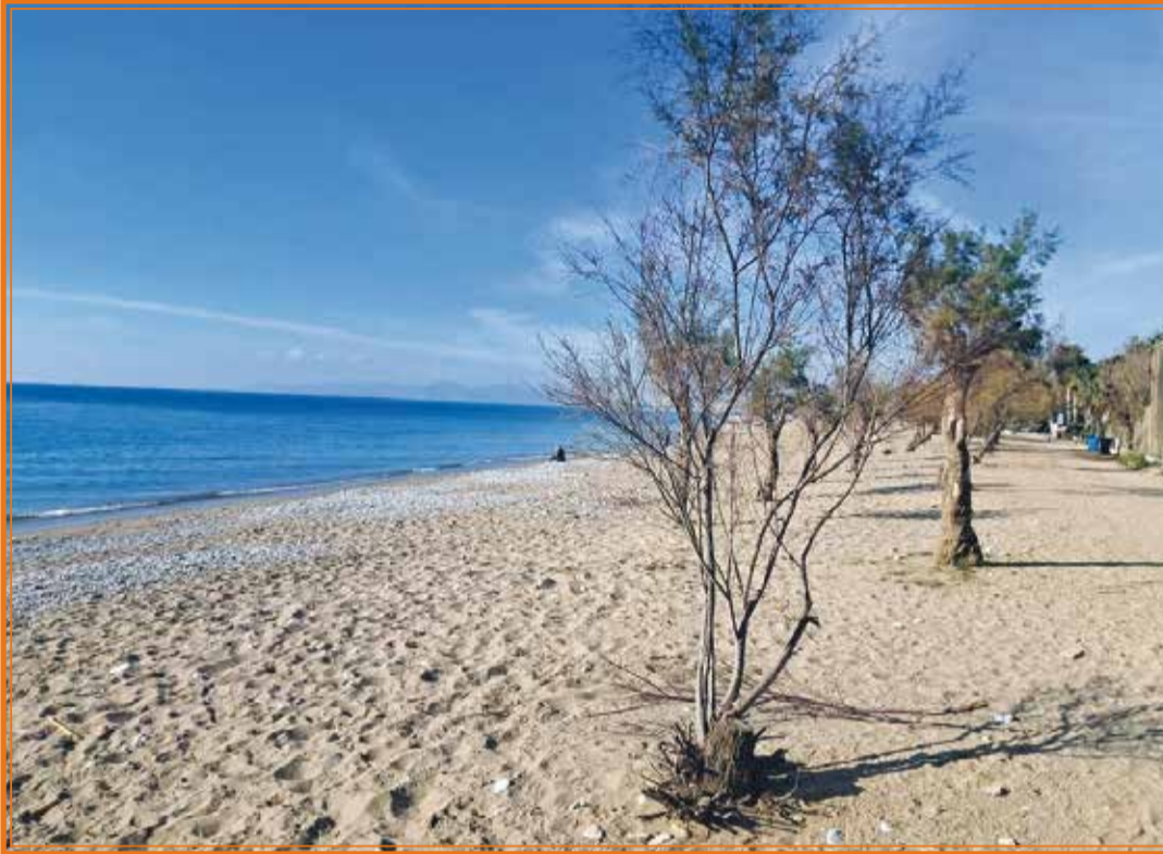
Στείλτε μας δικές σας φωτογραφίες στο e-mail: info@koinignomi.gr

Ανατολή ηλίου: 07:39 Δύση ηλίου: 17:28 Ανατολικό: Αββάδων των εν Σινά. Δυτικό: Φιλικίου, μάρτυρος.