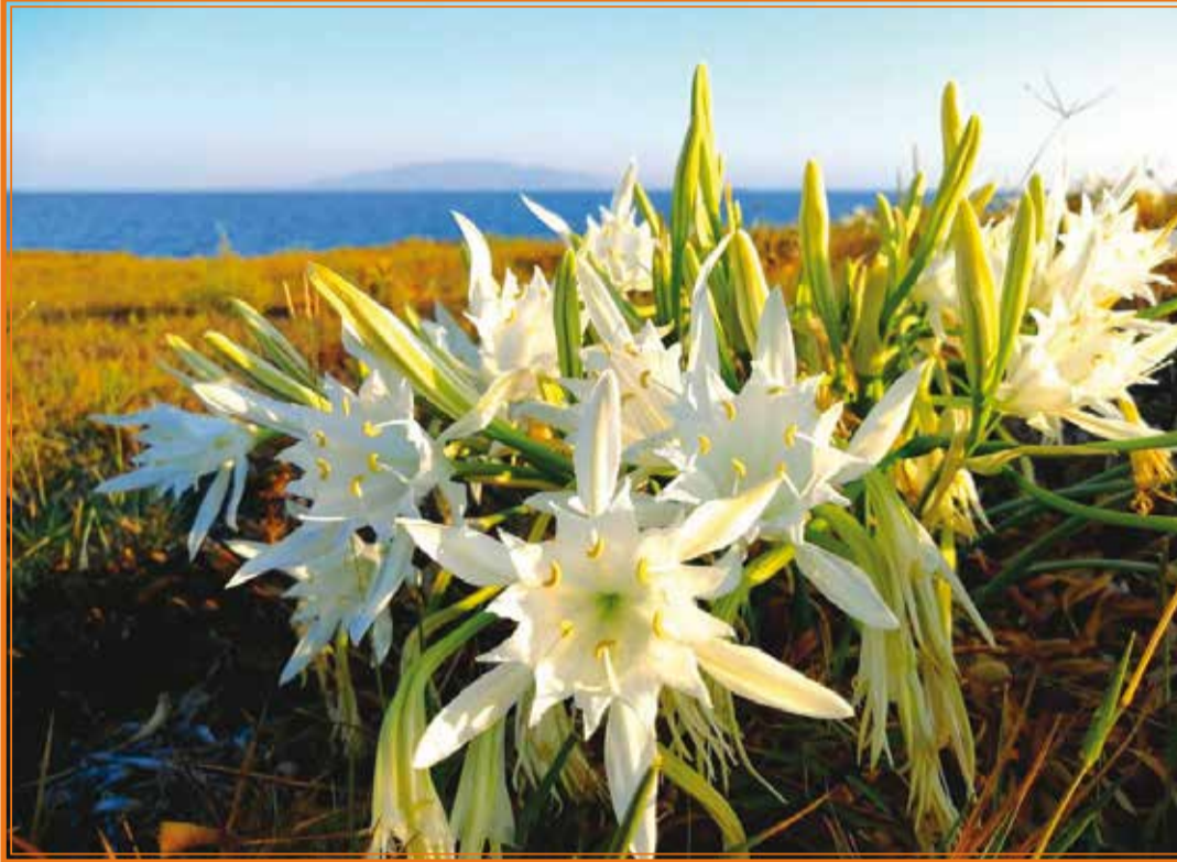
Η φωτογραφία της ημέρας: Κρινάκια. Στείλτε μας δικές σας φωτογραφίες στο e-mail: info@koinignomi.gr