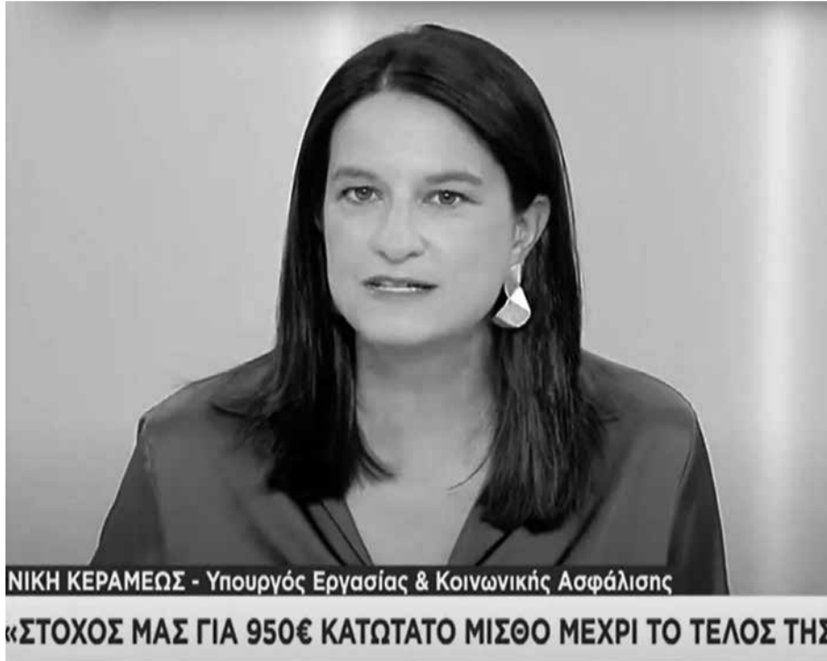
ΝΙΚΗ ΚΕΡΑΜΕΩΣ - Υπουργός Εργασίας & Κοινωνικής Ασφάλισης

«Από 3 Νοεμβρίου επεκτείνεται και σε νέους κλάδους, σε όλο το χονδρεμπόριο, σε όλον τον κλάδο της ενέργειας, σε χρηματοπιστωτικές υπη-